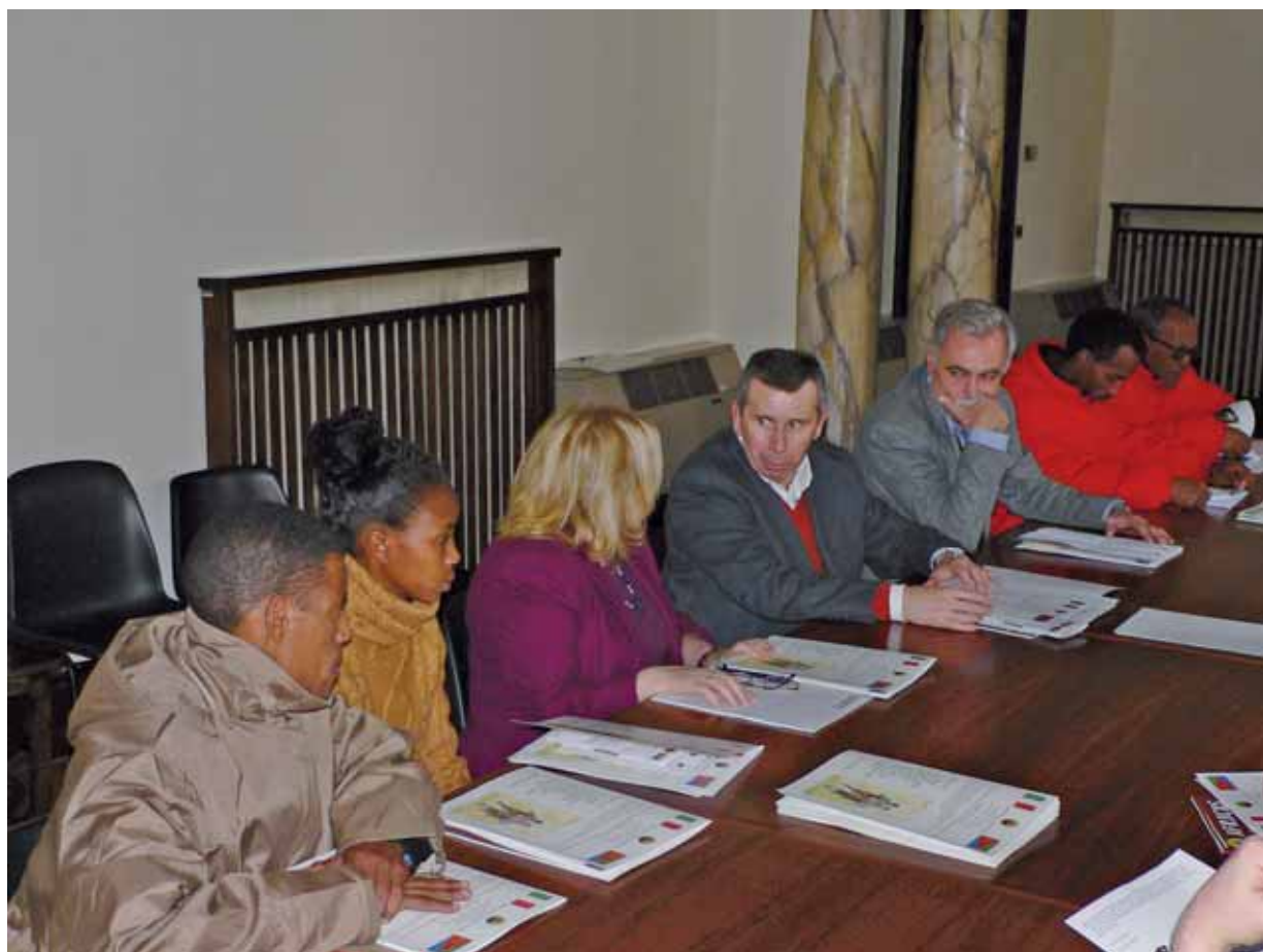
Conferenza stampa al Comune di Ferrara