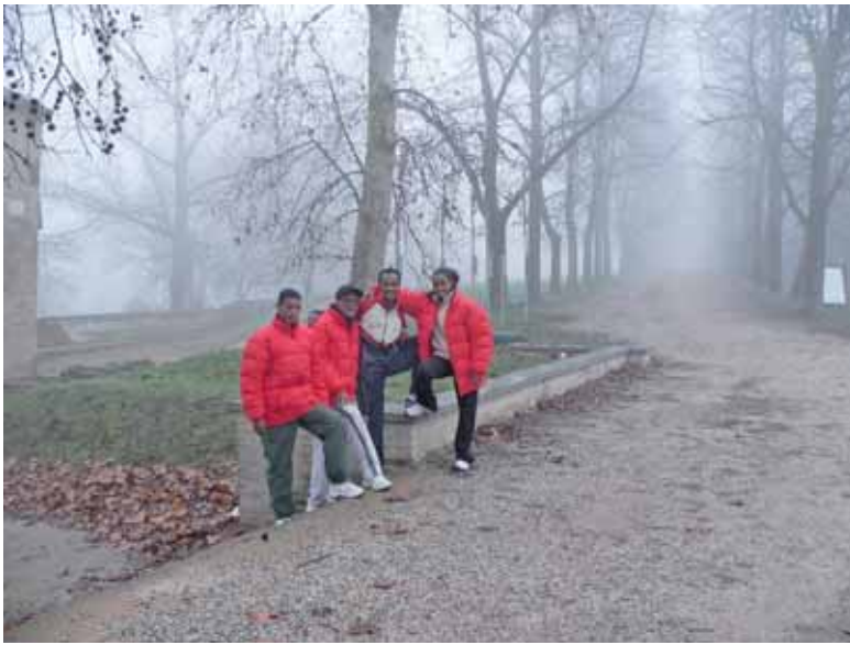
Il viale lungo le Mura di Ferrara dove si allenavano gli atleti eritrei.