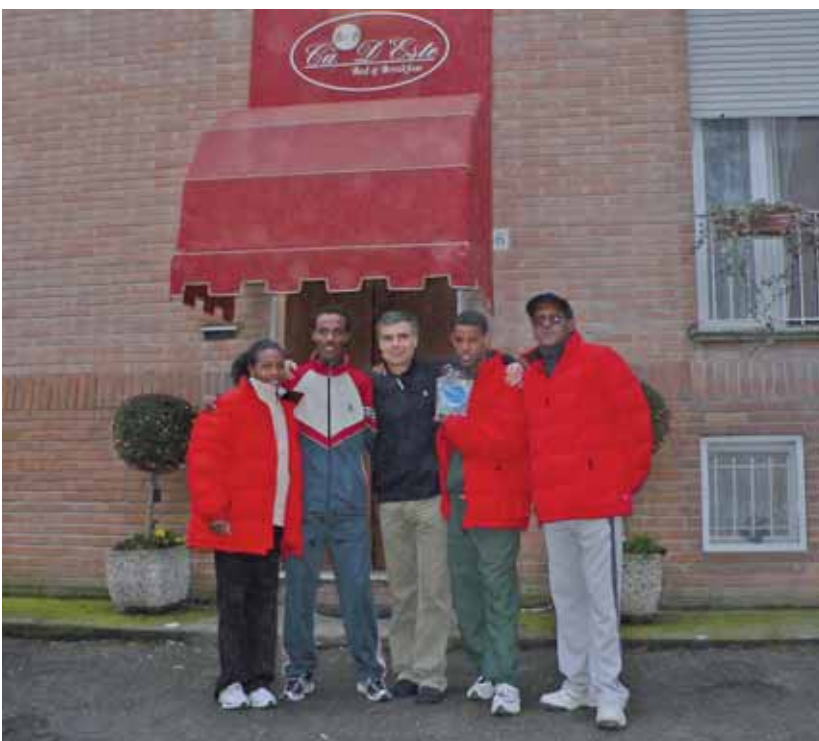
In posa di fronte ai loro alloggi a Ferrara