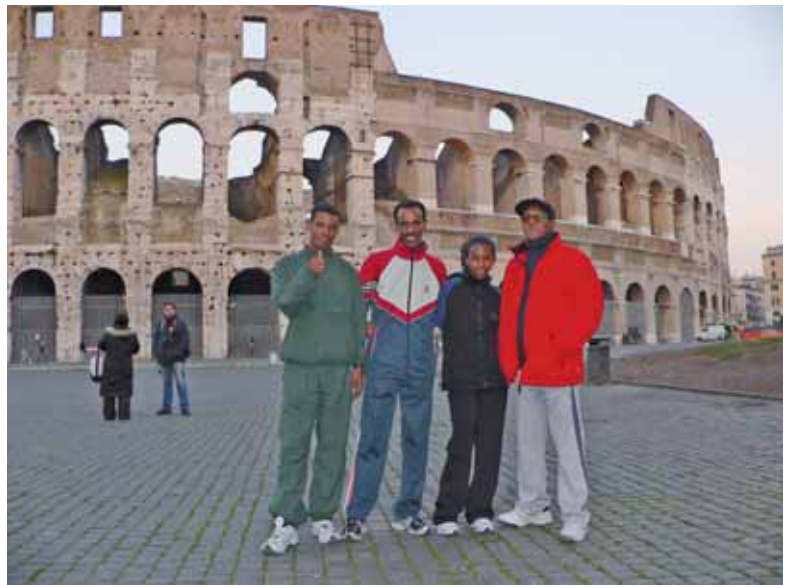
A Roma prima del rientro in Eritrea.